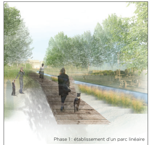
Phase 1 : établissement d'un parc linéaire