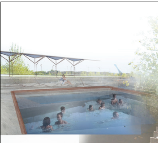
Phase 2 : bassins aménagés à partir des traces du passé