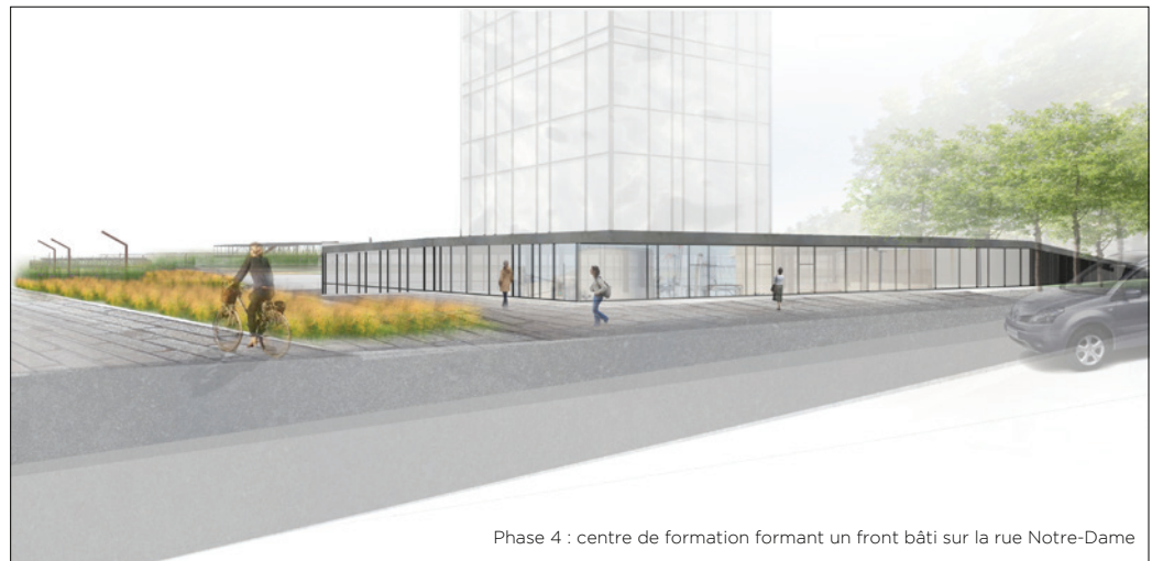
Phase 4 : centre de formation formant un front bâti sur la rue Notre-Dame