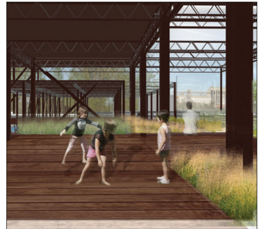
Phase 2 : structures d'un bâtiment présent à la phase 3