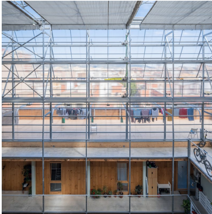
La Borda, Cooperative housing, architecte IACOL, Barcelona 2018

Le projet thèse est un travail individuel. Les documents livrables intègrent, approfondissent et raffinent la production effectuée au premier semestre.