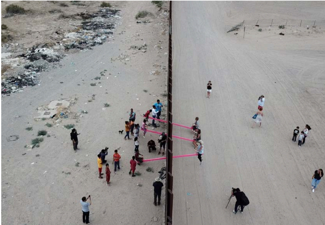
Real-San Fratello, Installation à la frontière EU-Mexique, 2019

migratoire, familière à beaucoup d'étudiants et travailleurs, s'impose de plus en plus comme une modalité contemporaine de vie transformant le contexte de l'architecture d'aujourd'hui, contexte auquel il convient de donner pleinement des moyens disciplinaires multiples.