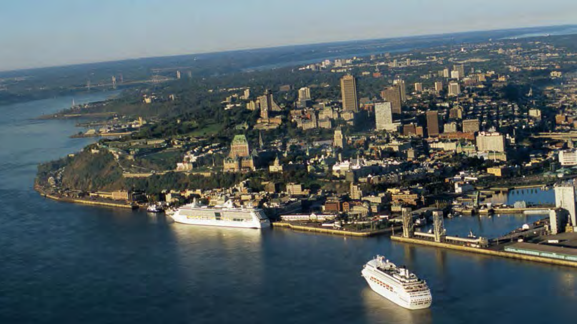
Le Vieux-Québec: site patrimonial décrété par le ministère de la Culture du Québec en 1964 et inscrit à la Liste du patrimoine mondial de l'UNESCO en 1985.