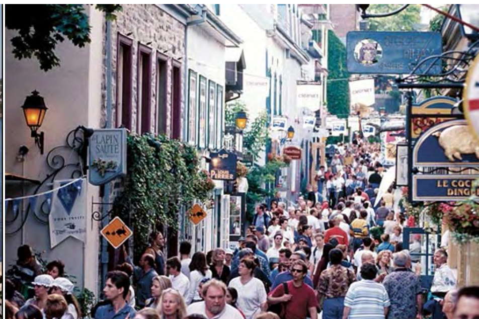
Rue du Petit Champlain dans la basse-ville