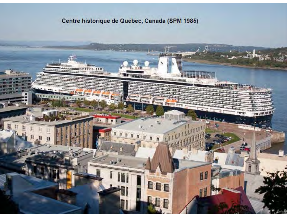
Centre historique de Québec, Canada (SPM 1985)

Ce qui a des impacts sur la population résidente (en diminution), le confort et la sécurité des piétons, disparition des commerces de proximité, transformation des appartements en hôtellerie (Air BnB)