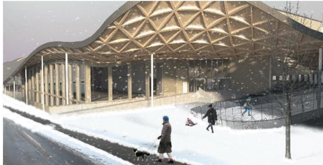
VUE EXTÉRIÈURE © 2020 JAMES LUCA PINEL ARCHITECTURE